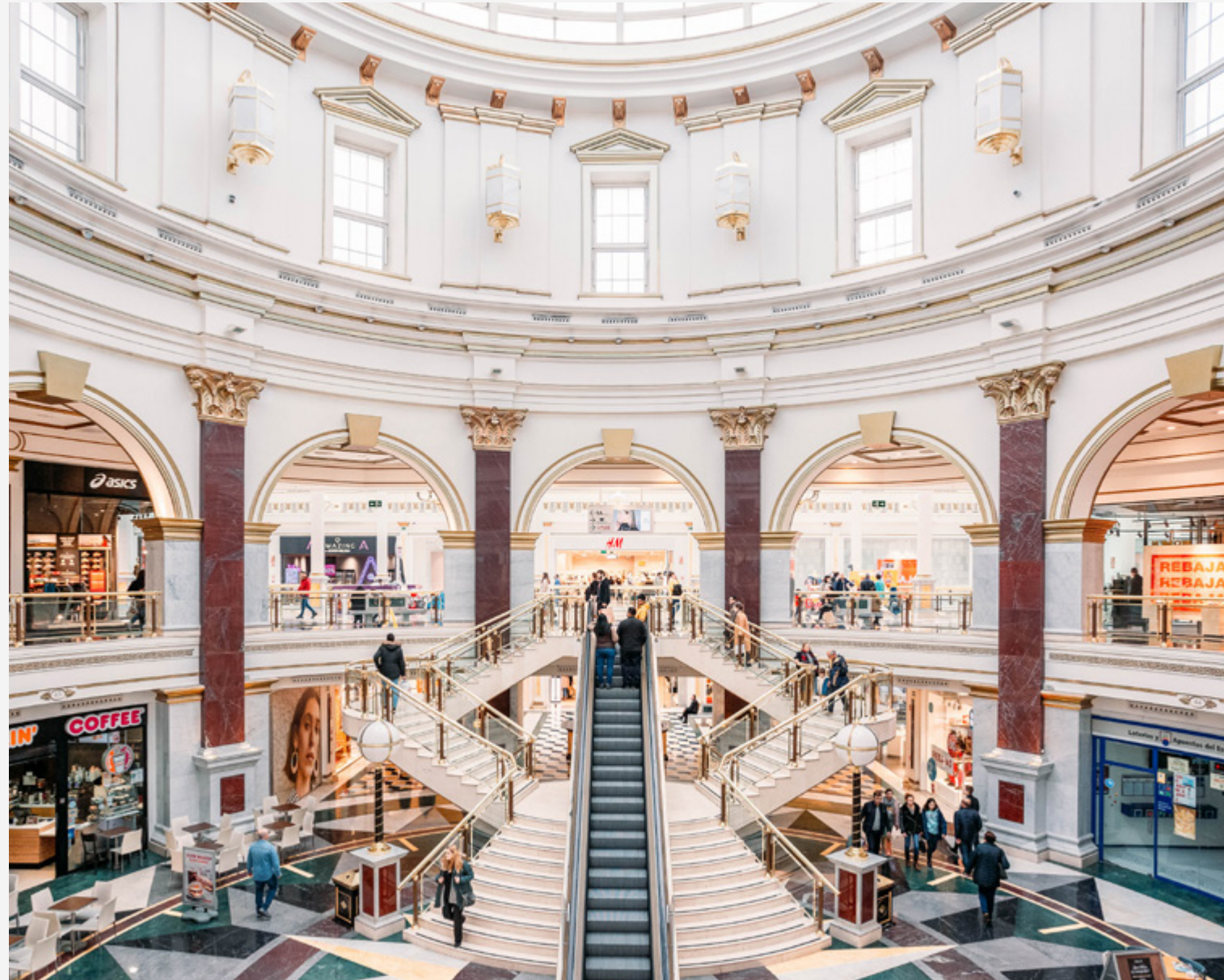
13' Plaza Norte desde Queens Lofts Plaza Norte desde Queens Lofts