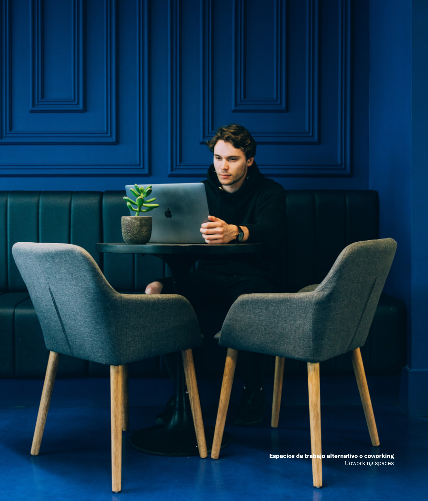
Espacios de trabajo alternativo o coworking Coworking spaces